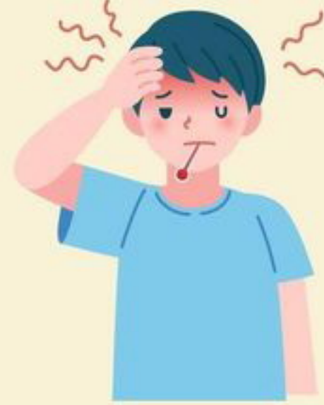
มีไข้สูง