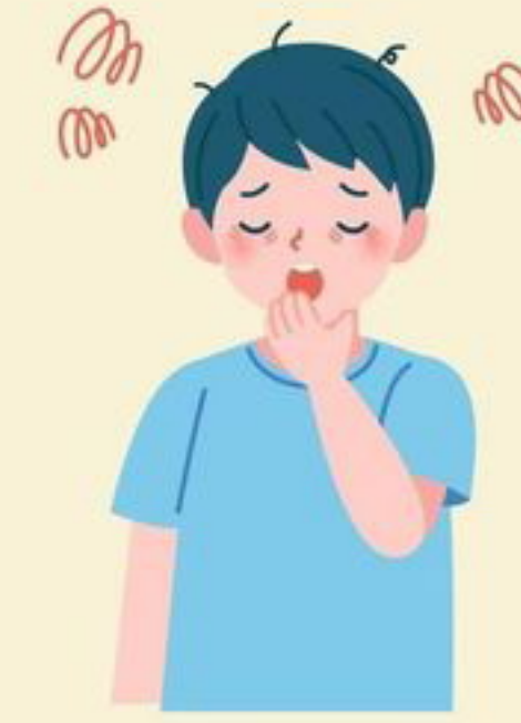
อ่อนเพลีย