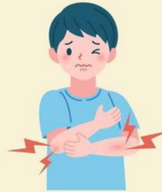
ปวดเมื่อยตามร่างกาย