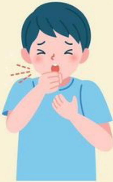
มีอาการไอ เจ็บคอ